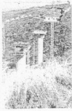
Notre couverture La Réunion - Le viaduc des Trois Bassins