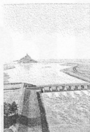
Notre couverture Le barrage du Couesnon